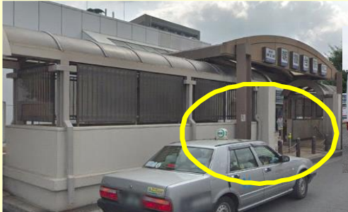
朝霞台駅南口 (ロータリー付近)