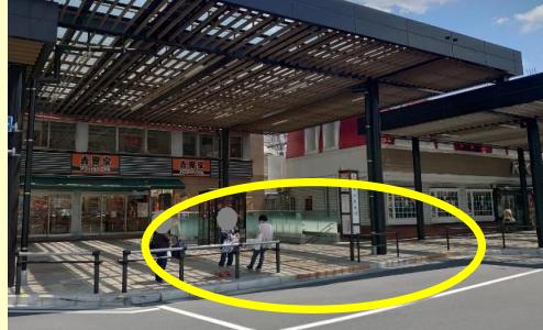
志木駅南口 (吉野家前付近)