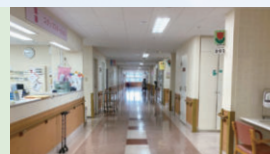
回復期リハビリテーション病棟