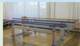
リハビリテーション室